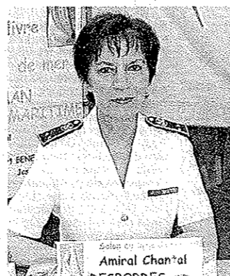
La marraine, première femme amirale, Chantal Desbordes.

Le salon sera l'occasion pendant trois jours - vendredi, samedi et dimanche - de rencontrer une cinquantaine d'auteurs, une dizaine de peintres, des photographes. Des conférences variées (au nombre de 13), des animations jeunesse (ateliers BD, fête des fautes) sont également prévues ainsi que de nombreuses animations musicales avec les Démanilleurs de Challans, la Clé de Sol, école de musique de Noirmoutier, les Sounurs, le groupe Globalement votre.